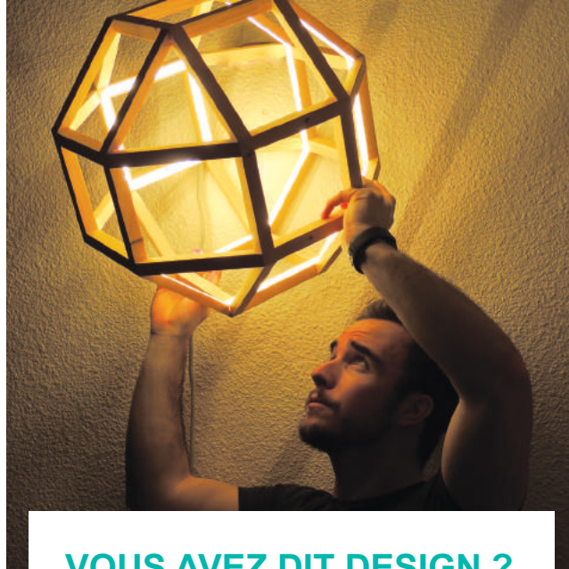
M. Mastrogiovanni « Rhomba », © M. Mastrogiovanni