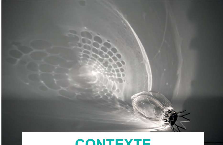
Lucie Le Guen « Cténophora » © Geoffrey Gatell