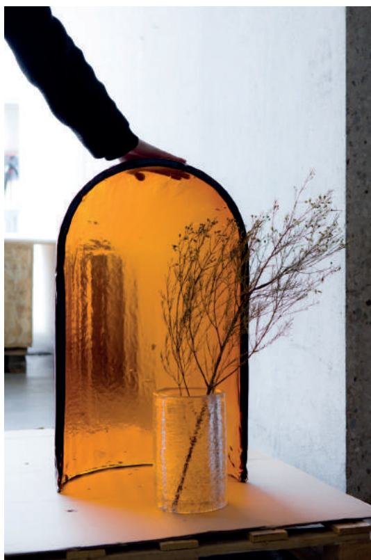
R. et E. Bouroullec « Alcova », © Claire Lavabre

En 2019, les Villes de Landerneau , de Quimperlé et l' École Européenne Supérieure d'Art de Bretagne s'associent pour témoigner de l'évolution du design en Bretagne sous toutes ses formes et présenter, à travers deux expositions inédites, le talent, la créativité et la capacité d'innovation des designers contemporains. Du sud au nord de la Bretagne, ce sont autant d'escalles qui questionnent sur le rapport étroit entre la création et les réalités économiques, sociales et environnementales qui l'entourent.